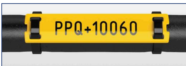
Repère de câble PPQ+